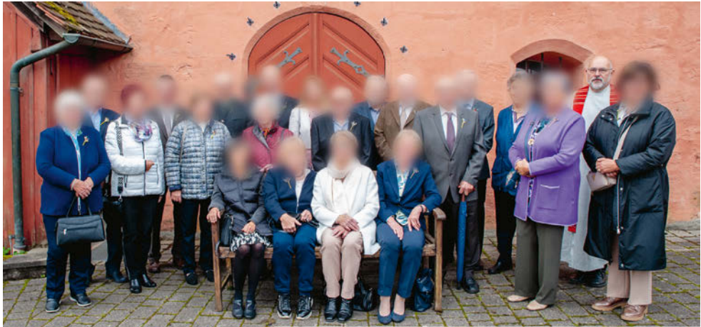
Alle Jubilarinnen und Jubilare

Beim anschließenden Mittagessen wurden Erinnerungsfotos ausgetauscht und natürlich die immer wieder gern gehörten Geschichten von damals weiter getragen. ■