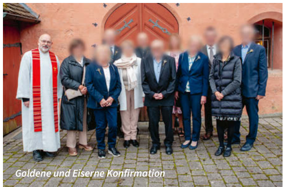
Goldene und Eiserne Konfirmation