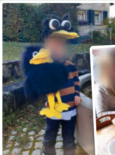
Gott versorgte Elia mithilfe der Raben mit Brot. Auch wir bitten ihn um Brot.